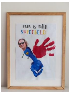
Mijn papa is een SUPERHELD!