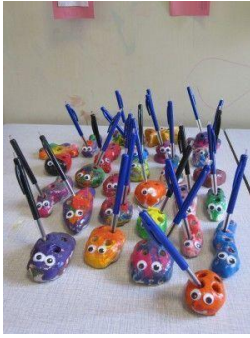
Een pennenhouder voor papa!